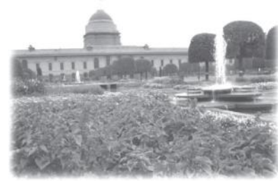
...मुगल गार्डन, राष्ट्रपति भवन...